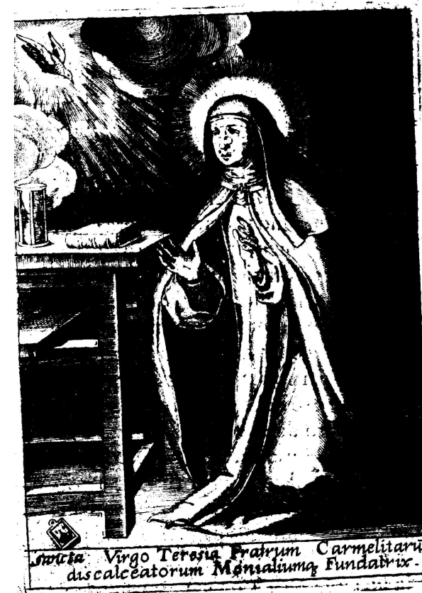
L'immagine della Santa pubblicata nel proemio

Si avvicina il 28 marzo 2015, quando ricorreranno i cinquecento anni dalla nascita di Santa Teresa d'Avila, proclamata dottore della Chiesa da Paolo VI: in questi giorni sosta a Brindisi e nel Salento una sua reliquia e contemporaneamente circola sul mercato dell'antiquariato librario (Studio Bibliografico Atlantis di Torino, a 580 euro) la «Relatione delle cose più notabili occorse nelle Fondazioni de' Monasteri che fece Santa Teresa di Giesu Fondatrice de' Carmelitani Scalzi. Scritta dall'istessa per ordine delli suoi Confessori. ...Tradotta nuovamente dalla lingua spagnola nell'Italiana da un Religioso del medesimo Ordine de' Scalzi». Si tratta di un libro in 8° di circa 400 pagine, una rara prima traduzione italiana del « Libro de las fundaciones de las Hermanas Descalças Carmelitas» di Santa Teresa, «una delle figure più importanti della Riforma cattolica grazie alla sua attività di scrittrice e riformatrice delle monache e dei frati Carmelitani Scalzi».