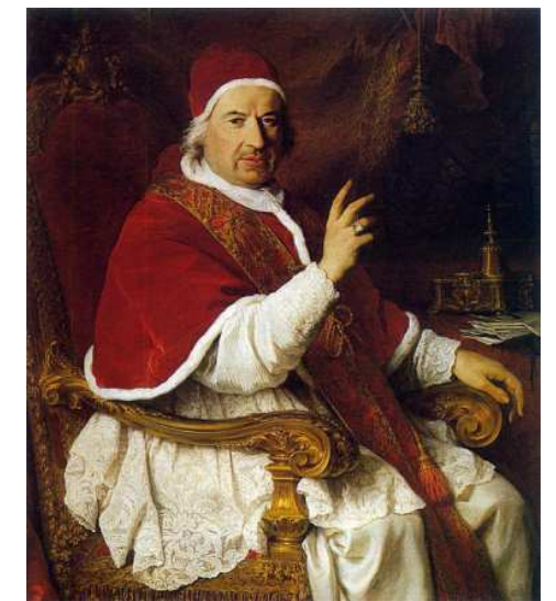
Pierre Subleyras, Benedetto XIV, olio su tela

non furono più restituiti ai carmelitani. È ipotizzabile, pertanto, che attualmente molti di questi volumi siano conservati presso la biblioteca comunale "F. Trinchera senior"; altri potrebbero essere transitati in epoca successiva nel fondo antico della biblioteca diocesana pubblica "R. Ferrigno" di Ostuni (poiché alcune di tali opere risultano riportate in una pregevole pubblicazione del 2013 contenente l'inventario analitico del patrimonio diocesano); altri ancora, purtroppo, sono andati perduti o sono entrati a far parte di qualche raccolta privata (mi riferisco, in particolare, a sei "antiche platee e manuali di esazione degli ex Francescani, ex Domenicani ed ex Carmelitani", conservate nel convento fino al 1861, la cui scomparsa ha determinato un danno irrimediabile). Il segreto auspicio di chi scrive - ovviamente - è che tale patrimonio librario venga integralmente individuato e che tutte le opere perdute un giorno "ricompiano".