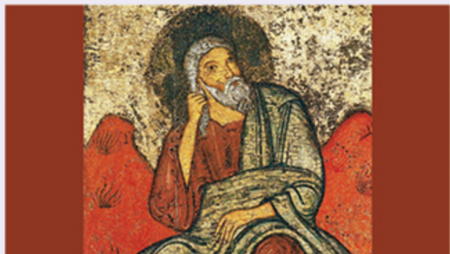
Sant'Elia, sec. XIII-XIV

Nel periodo bizantino (sec. IV-VII) vi fu sul Carmelo una grande fioritura di eremiti, cenobiti e monaci, attratti dall'esempio di Elia. Nel medioevo, al tempo dei Crociati, il Monte Carmelo si ripopolò ancora di monaci e vi si originò l'ordine carmelitano che tanta gloria avrebbe dato a Dio. Nel sec. XVIII si costruì una bella chiesa sopra la cosiddetta grotta di Elia, che è l'attuale santuario detto "Stella Maris", visitato ogni anno da migliaia di pellegrini non solo cristiani, ma anche musulmani. Così il Carmelo, con la sua vita rigogliosa e i suoi ricordi biblici, offre anche ai nostri giorni spazio alla vita spirituale all'ombra della Madonna.